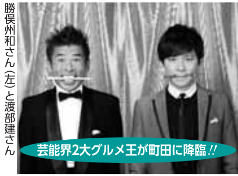
芸能界2大グルメ王が町田に降臨!!

また、開催初日には会場です。勝俣さんと渡部さんが、各店舗の行きつけになった理由や味へのこだわりなどをプレゼンテーションします。 2人のグルメ王がごよなく愛する絶品料理の食べ比べをお楽しみ下さい。 ※参加店舗やイベントの情報は、「芸能界グルメ王美食祭」ホームページ（http://king-of-gourmet.com）で随時発信します。 開催日時 4月28日（木）～5月