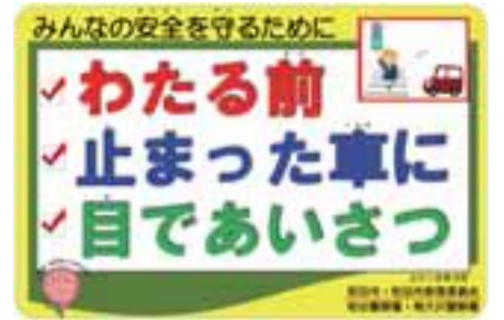
この標語をポスターにし、市内公立小・中学校の全学級に配布しました

この標語は、「道路を横断する際に、運転手が自分に気付いているかどうか確認することの大切さ」を訴えています。ご家庭でもこの標語を活用し、お子さんが安全確認の習慣を身に付けられるよう、ご協力をお願いします。