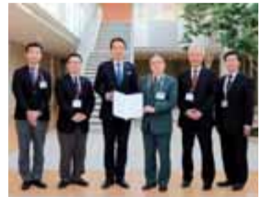
神奈川東部ヤクルト販売(株)の皆さん

この度、高齢者の見守り活動の強化と徘徊高齢者の捜索体制を更に充実するため、株式会社セブニーイレブン・ジャパン（市内59事業者）、神奈川東部ヤクルト販売株式会社（市内7事業者）の2社と、町田市高齢者の見守り活動