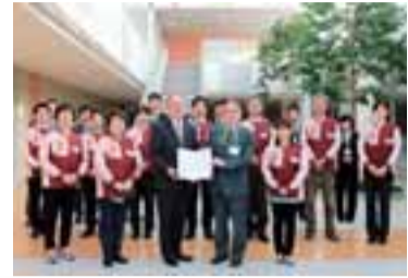
(株)セブニーイレブン・ジャパンの皆さん

見守りネットワークまちだ セブニーイレブン・ジャパンと 神奈川東部ヤクルト販売 高齢者の見守り活動に関する協定を締結しました 市では、市内で活動する事業者と協力し、地域に住む高齢者を見守る体制（見守りネットワークまちだ）づくりを進めています。