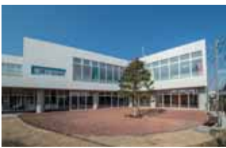
4月、中町にオープンする子どもセンターまあち

2016年4月に、市内5館目の子どもセンターとなる「子どもセンターまあち」が中町にオープンします。中心市街地にあることから、中高生や乳幼児親子向けの機能が充実した施設となるよう準備を進めてまいります。 また、今後は、5つの子どもセンターから一定の距離がある地区に、中学校区単位で子どもクラブの整備を進めます。2016年度は、町田第三中学校区内で子どもクラブの整備に着手します。 教育環境の整備では、町田第一中学校の改築に向け、基本設計を実施します。また、夏季の猛暑対策として、小中学校の理科室、家庭科室等の特別教室に空調設備を設置し、学習環境の向上を図ります。