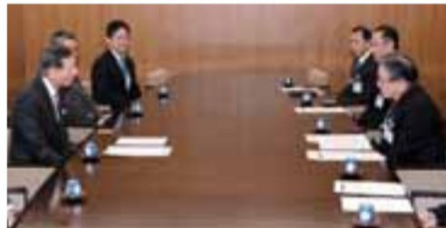
2月29日に南町田駅周辺のまちづくりに関する共同推進協定を結びました