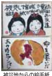
被災地からの絵手紙

東日本大震災で被災した東 北への思いがこもった絵手紙 や写真を展示します。 ※いずれも直接会場へおいで 下さい。