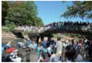
かいぼり当日は多くの方にぎわいました