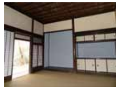
特別公開される室内

○会場 同公園内旧荻野家住宅 ○定員 各20人(先着順) ○日時 3月26日(土)午前10時15分〜11時45分、午後0時15分〜0時45分(いずれも同一内容)