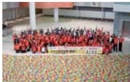
多摩都市モノレール 町田方面延伸機運醸成事業でギネス世界記録®を達成しました

「基幹交通のプロジェクト」では、多摩都市モノレールの町田方面延伸と小田急多摩線延伸について、国の交通