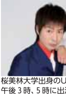
桜美林大学出身のU字工事 午後3時、5時に出演(各30分間)

市では、まちだの魅力を戦 略的・継続的に市内・市外へ 発信する、シティプロモーシ ョン活動を展開しています。 この度、横浜で、町田市の 魅力を発信するイベント「東 京まちだ博」を開催します。 当日は、町田市ゆかりのお 笑いコンビ「U字工事」によ