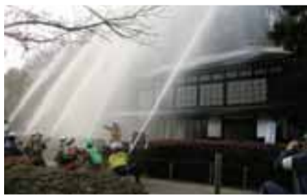
昨年の消防演習の様子

文化財防火デー 町田市民センターは改修工事のため、2月1日(月)〜10月28日(金)の期間、第3駐車場に建設した仮設庁舎(左図参照)で窓口業務を行います。