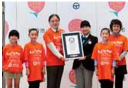
公式認定員から公式認定証が授与されました

このイベントは、多摩都市モノレール町田方面延伸の機運を醸成し、市内外に向けて取り組みを周知するため、「つながれモノレール! つながれ紙チェーン!」を合言葉に、多摩都市モノレール町田方面延伸促進協議会(下表参照)が開催したものです。 当日は、公募による参加者を中心に115人が参加し、見事な集中力と、抜群のチームワークで、目標の2000mを大幅に超えて、世界記録を達成しました。