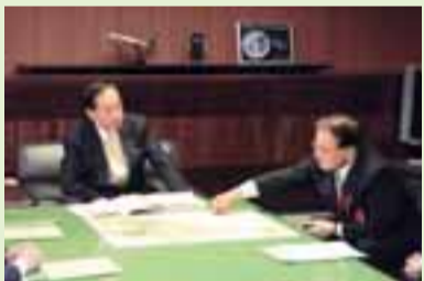
石阪市長(右)から太田国土交通大臣(当時)に延伸の意義・必要性を説明しました(3月24日)