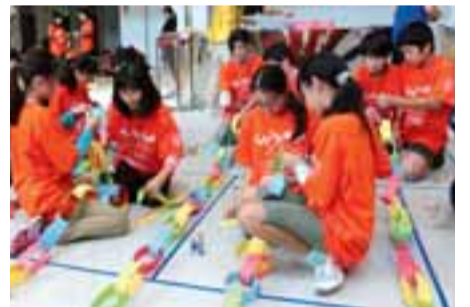
2人1組で一心不乱にチェーンをつなぎました