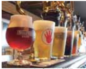
クラフトビールも登場