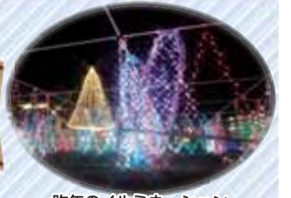
昨年のイルミネーション(今年は内容が異なります)