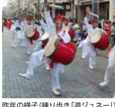
昨年の様子(練り歩き「道ジュネー」)