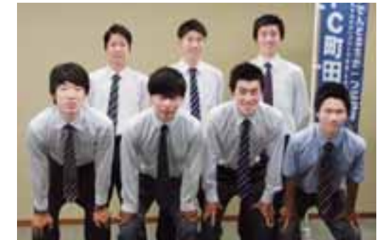
FC町田ゼルビアのユースチームの皆さん