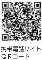
携帯電話サイト QRコード

市では、忠生地区を対象にした「土砂災害ハザードマップ」を作成しました。 このマップは、土砂災害防止法に基づき、東京都が土砂災害警戒区域・土砂災害特別警戒区域を指定したことを受けて、該当する区域を地域の皆さんにお知らせするものです。 マップの「地図面」では、区域内で土砂災害発生のおそれがある場所や、避難施設を認めることができます。 「情報面」には、土砂災害の基礎知識や避難に関する情報を掲載しています。 日ごろからの土砂災害への備えにご利用下さい。 配布時期 7月21日(火)から順次 配布方法 対象地区の住宅や事業所のポストに投函 ※防災安全課（市庁舎3階） や各市民センターの窓口等で