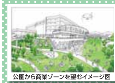
公園から商業ゾーンを望むイメージ図