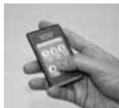
来場者の皆さんもリモコンで評価できます

評価人は、専門知識を持つ有識者だけでなく、市民の方も含まれます。市民の方と、行政が抱える課題や問題意識を共有し、一緒に考えていたことで、より透明性の高い行政運営につなげます。