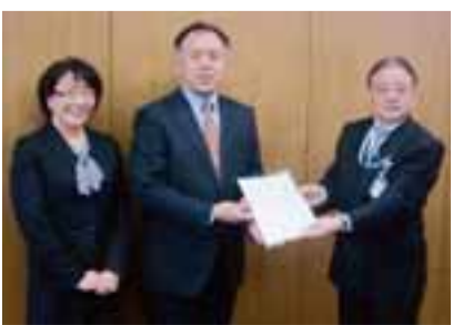
3月25日に答申を受けました

問 子ども総務課 ☎724・28377 876 FAX 050・3101・8377