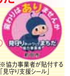
※協力事業者が貼付する「見守り支援シール」

高齢者の見守り活動の強化と徘徊高齢者の搜索体制（見守りネットワークまちだ）を充実するため、市内全域の配達業務を行う郵便局（町田・町田西・鶴川郵便局）と、「町田市高齢者の見守り活動に関する協定」を締結しました。今回の協定で、市と連携する協力事業者は、102事業者となります。