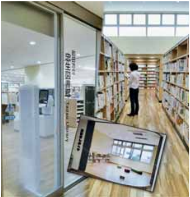
7万冊の本が待ってます。ぴかぴかの図書館に来て下さい！

20、忠生図書館 ☎792・3450（5月1日から） 問 中央図書館 ☎728・822