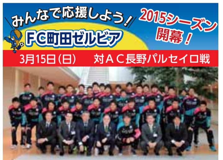
2月27日にFC町田ゼルビアの皆さんが市役所を訪問し、開幕戦に向けて強い意気込みを語られました

市民課 課税・非課税証明書、納税証明書の交付 【納税課】納税の受付・相談 土・日曜日でも証明書を取得できます 町田・鶴川・南町田の3駅前連絡所は、土・日曜日にも、住民票の写し、印鑑登録証明書、戸籍謄・抄本等を発行しています。 ○開所時間 月・金曜日 午前8時30分～午後7時、土・日曜日 午前10時～午後5時 ※祝・休日はお休みです(鶴川駅前連絡所は第1・3月曜日もお休み)。