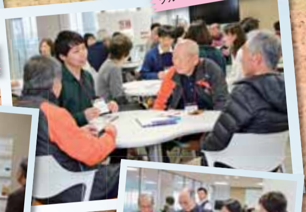
『まちだ自慢』を真剣に読み込むサポーターの皆さん