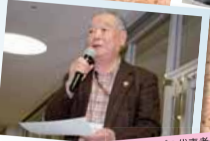
各グループの代表者が前に出て報告