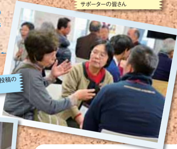
グループでベスト投稿の話し合い