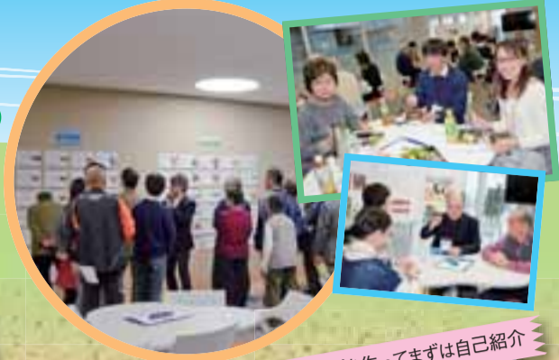
グループを作ってまずは自己紹介

1月17日(土)、市庁舎2階の市民協働おうえんルームで、『まちだ自慢』ミーティングを開催しました。この日は32人のサポーターが出席。ミーティングでは本紙「広報まちだ『まちだ自慢』特集号」作成のため、これまでサポーターの皆さんによって投稿された『まちだ自慢』の記事の中から、グルメ、自然・文化・歴史、イベント等、これぞまちだ自慢!と言える「ベスト投稿」をグループごとに選びました。世代を問わずに楽しむことができる「薬師池公園」や、市内外からも多数の団体が参加する「フェスタ町田」など、複数のグループによって選出された投稿がある一方で、町田のことをよく知るサポーターならではの視点で選ばれたものもありました(この日選ばれた投稿の詳細は、本特集号の2面と3面でご紹介しています)。