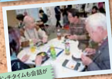
ランチタイムも会話が弾みます