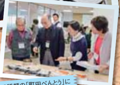
3種類の「町田べんとう」にみなさん興味津々