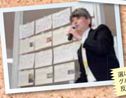
選ばれた『まちだ自慢』は、グループごとの視点が反映されました