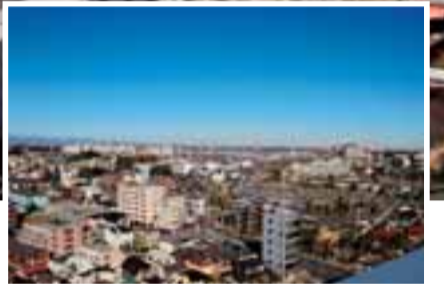
忠生・小山田方面