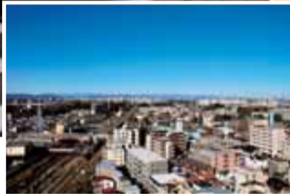
淵野辺・橋本方面