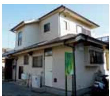
野津田あんしん相談室