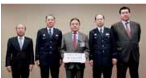
左から、(公社)東京都宅建物取引業協会町田支部長、町田警察署長、石阪市長、南大沢警察署長、(公社)全日本不動産協会東京都本部町田支部長