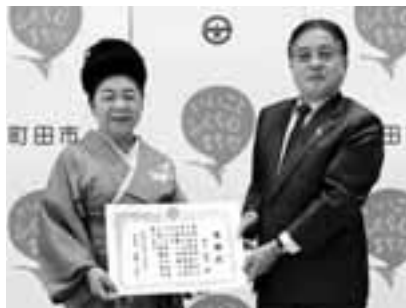
11月16日に感謝状を贈呈しました

からの推薦により、さまざまな主体と連携・協力して地域の課題を解決している個人・団体に、春と秋の年2回、感謝状を贈呈しています。 固市民協働推進課 ☎724・4358 FAX 050・30805