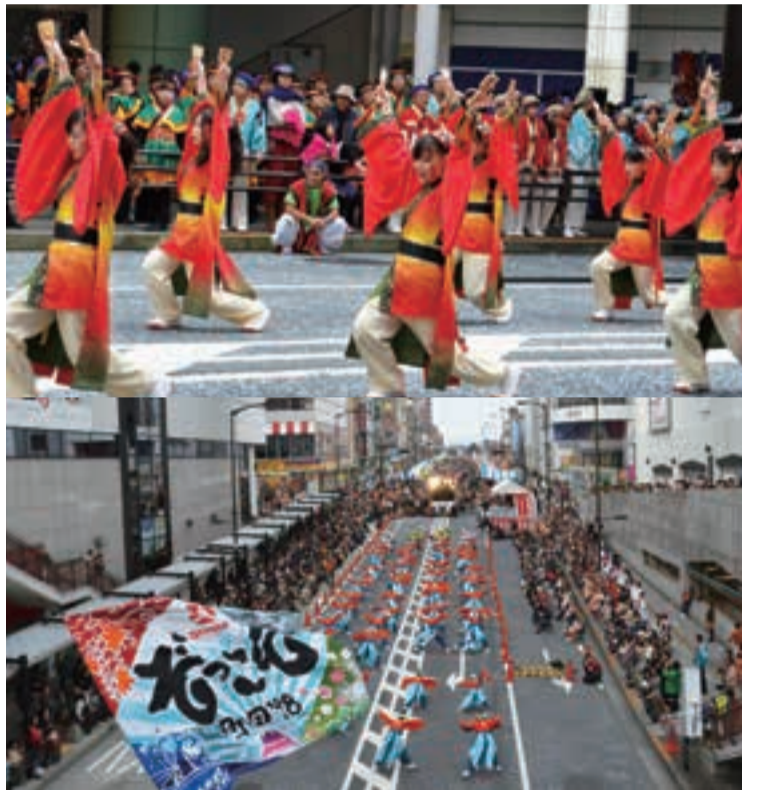
寒さを吹き飛ばす、よさこいの熱気