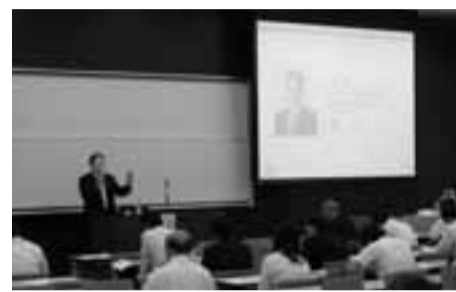
8月27日に「公会計改革推進シンポジウム」で講演を行いました

町田市の取り組み内容や、市民に理解できる会計制度としての複式簿記導入の必要性などについて、基調講演としてお話しすることができました。事業別財務諸表は、今、開かれている9月議会にも、決算審査参考資料として情報提供しています。これからも、より開かれた市政のための情報提供に努めていきます。