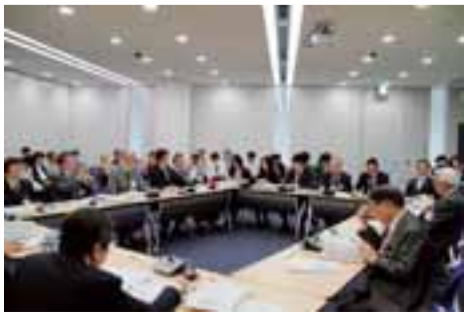
市長の意見を目の前で聞く ことができます

「わんぱくおもちゃ作り」 「ねんくみ」シリーズ。 本展は、全25作を数える人 気シリーズの名場面を原画で 紹介し、元気でわんぱくな 「ねんくみ」が、気が弱く て泣き虫の「ねんくみ」が、学校 を舞台に繰り広げる楽しい世 界へ誘います。 ○観覧時間 午前10時～午後 5時 ○休館日 毎週月曜日(ただ し7月21日、9月15日は開 館)、8月14日(木)、9月11 日(木)