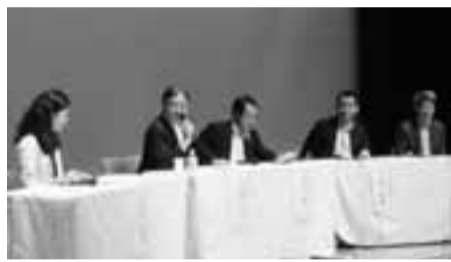
6月30日に開催した多摩都市モノレール・シンポジウム

芙蓉の花やタチアオイの花が咲き、夏の花が始まりました。住宅地ではゴーヤや朝顔のグリーンカーテンも丈が伸びてきました。先月末、サッカーワールドカップを見ようと、夜中に起き出してみたら、すぐ近くでアオバズクがホーッ、ホーッとふた声ずつ鳴き続けていました。ホーッの前の小さい「ロ」の音まで