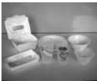
リユース食器・リサイクル容器