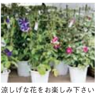
涼しげな花をお楽しみ下さい

※研究会報告書の詳細は、市政情報課(市庁舎1階)、各市立図書館でご覧いただけます(町田市ホームページでダウンロードも可)。 町田交通事業推進課 ☎724・4260 FAX 050・3161・6322