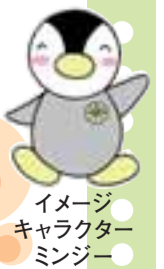
イメージキャラクター ミンジー