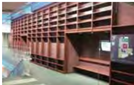
プロデュース企画の対象となる壁面

企画は2014年3月に実 施を予定しています。採用さ れた企画の提案者は、その企 画のプロデューサーになって いただきます。