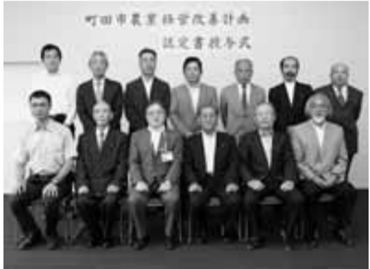
授与式では、石阪市長から一人ひとりに認定書が手渡されました