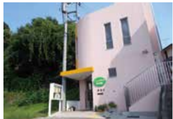
幼保連携型認定こども園の「こっこのもり保育園」

保育園待機児童は0歳～2歳までのお子さんが大半を占めるため、市では既存の幼稚園に0歳～2歳までの認可保育園の機能を持たせて、0歳から就学前まで継続して幼児教育・保育を一体的に行うことができる、幼保連携型認定こども園の整備を進めています。