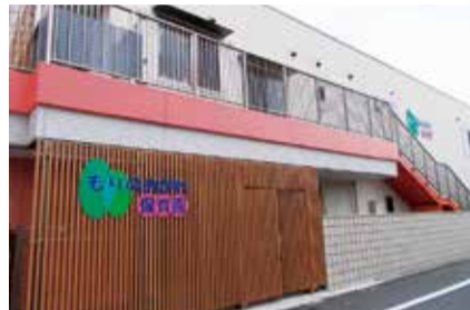
20年間期間限定認可保育園の「もりのおがわ保育園」

20年間期間限定認可保育園は、現状の保育園待機児童の増加と将来見込まれる未就学児童の減少の、両方に対応できるよう町田市が独自に始めた整備方法で、既存の建物や民有地を有効活用することで、短期間で認可保育園が開園できるという大きなメリットがあります。この方法で2010年4月から2013年4月までに13園を開園し、定員が1139人増えました。