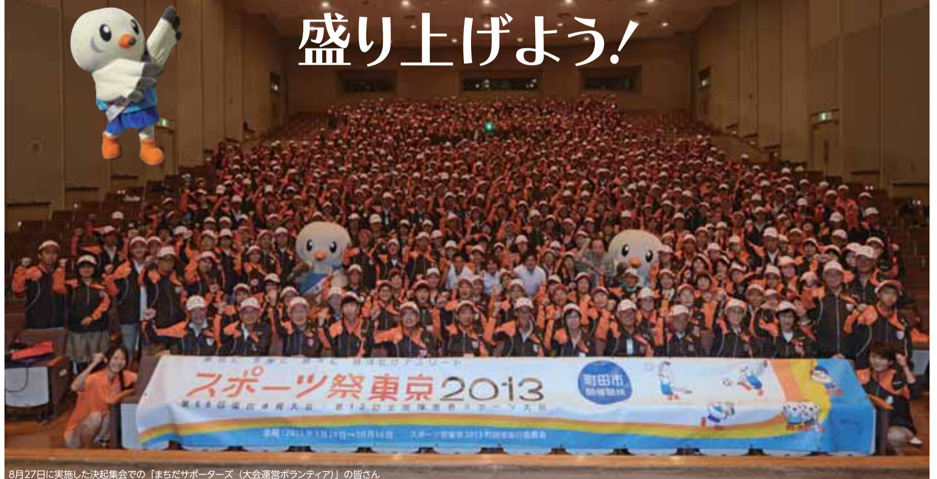
8月27日に実施した決起集会での「まちだサポーターズ(大会運営ボランティア)」の皆さん