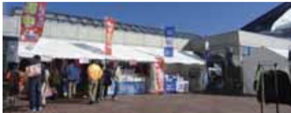
昨年のリハーサル大会での会場内売店

スポーツ用品 飲食物(焼きそば、パン、お菓子等) ゆりーとグッズ 観光土産品 記念切手