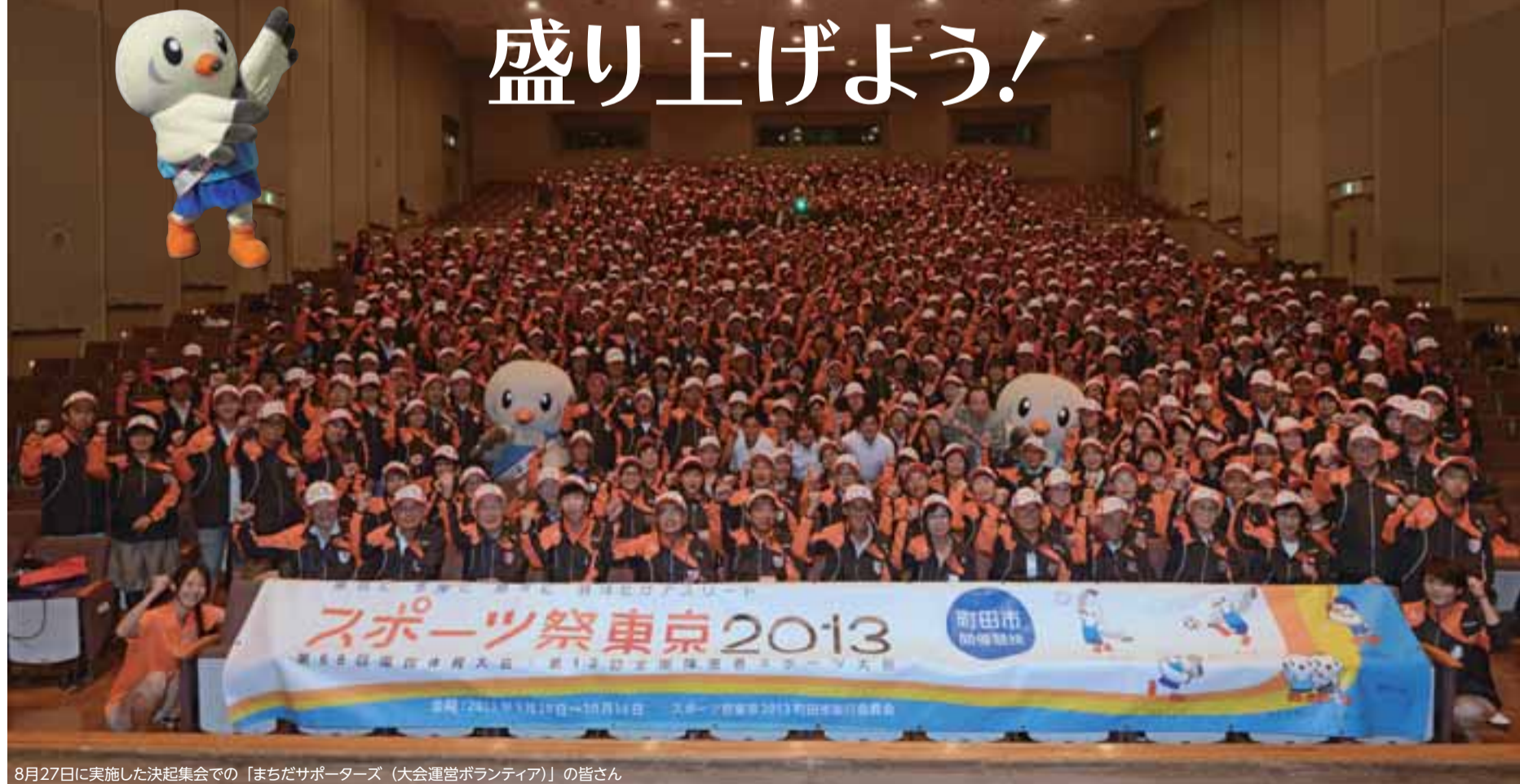
8月27日に実施した決起集会での「まちだサポーターズ(大会運営ボランティア)」の皆さん