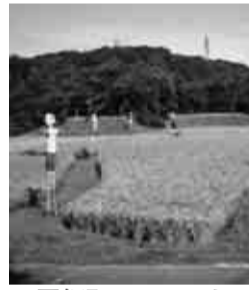
図師町の、かかしのある風景