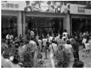
ほっぽ町田のリニューアル・オープン式典

申請座名・住所・氏名・勤務先(在勤の方)を明記し、10月1日まで(必着)にハガキまたはEメールで(財)町田エコライフ推進公社(〒194-0202、下小山田町3160、町田リサイクル文化センター内、☎ecokoz@ecokosh.aic.jp)へ。