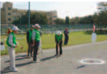
グラウンドゴルフは各クラブで盛んに行われています!

市では、老人クラブの活動を支援しています。「老人クラブに興味がある」「加入したい」とお考えの方は、お気軽にお問い合わせ下さい。