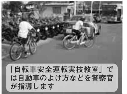
「自転車安全運転実技教室」では自動車のよけ方などを警察官が指導します

時間 午前9時～11時30分(受け付けは午前8時30分から) ※実技・テストを受講した小学生には顔写真の入った子ども安全免許証を交付します。 「百バイ隊員による二輪車交通安全講習会」