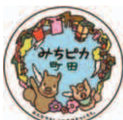
ステッカーは、直径10.6cmと8.1cmの2種類です

「まちピカ町田」のリーフレットとステッカーは、道路管理課(市役所本庁舎9階)で配布しています。