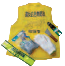
活動に必要な簡易工具を貸与します

●対象 市内在住、在勤、在学の方18歳以上の方2人以上で構成する団体 ※活動開始前に、講習会を受講していただきます。 問 道路管理課 ☎724・1151 FAX 050・3160・7628