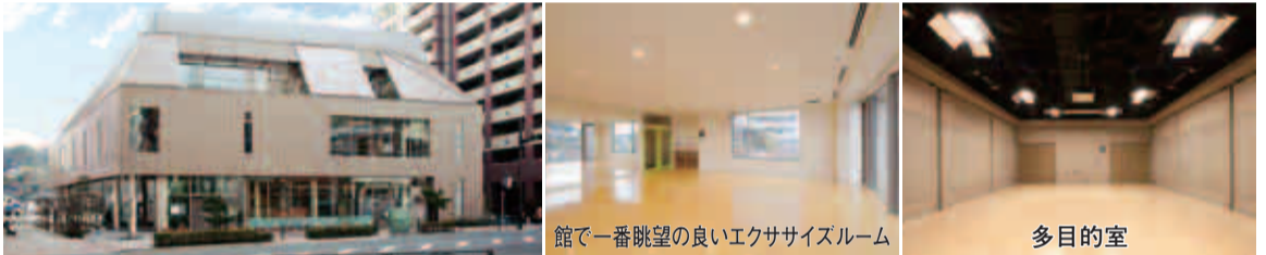
館で一番眺望の良いエクササイズルーム 多目的室

和光大学ポプリホール鶴川は、貸出施設・駅前連絡所・図書館を備えた複合施設です。鶴川駅からも近く、土・日曜日にも開館しています。ぜひご利用下さい。