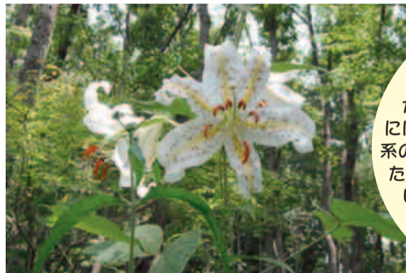
7月11日に図師町で撮影した「ヤマユリ」

この取り組みは、私たちの暮らしを支えている生物多様性を将来にわたり守り続けていくためのもので、市民・事業者の皆さんとともに進めていきます。