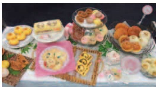
おいしいそうなスイーツが盛りだくさんです

野鳥のほろは子育てもほら終わって、あまり見かけなくなってしまうが、花のほろはこの季節ならではの風情があります。 毎朝の犬の散歩の折には、まことに色とりどりのアシサイ(紫陽花)を楽しんでいきます。 タチアオイ