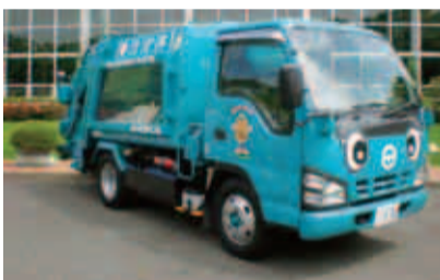
みえるくんはパッチリ目玉にスッキリみえみえお腹です

子どもたちに、ごみや環境に対する関心を高めてもらうため、ごみを入れる箱の外から見える、スケルトン収集車「みえるくん」が誕生しました。 みえるくんは、保育園や幼稚園、小学校等を訪問して、ごみの分別や、環境に配慮する意識を持つことの大切さを