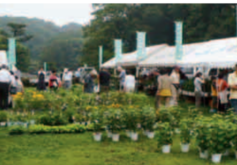
昨年も多くの人に来場いただきました

鉢物のほおずき(1〜3本立ち)や、あさがお(あんどん風仕立て)、山野草を市内の生産者が販売します。 また、地元生産者による新鮮野菜の販売もあります。 ○日時 7月6日(土)・7日(日)、午前8時〜午後4時30分(雨天実施) ○会場 薬師池公園芝生広場 ○交通 小田急線町田駅北口POPビル先21番乗り場から、本町田経由野津田車庫行き、または本町田経由鶴川駅行きバスで「薬師池」下車、徒歩3分 ☎公園緑地課 ☎724・4399 FAX050・3161・6269