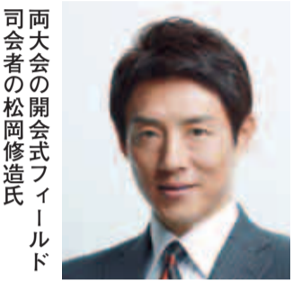
両大会の開会式フィールド司会者の松岡修造氏

9月～10月に、味の素スタジアムで行われる、スポーツ祭東京2013(第68回国民体育大会・第13回全国障害者スポーツ大会)の開会式・閉会式の観覧者を募集します。国民体育大会の総合開会式