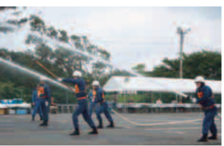
昨年も本番さながらの操法が披露されました

○日時 6月30日(日) 午前8時30分から(雨天実施) ○会場 町田リサイクル文化センター隣接地(下小山田町)