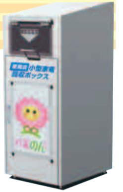
公共施設等に設置する回収ボックス

市では、デジタルカメラやゲーム機などの小型家電製品に含まれている金・銅などの有用金属や、「レアメタル」と言われる希少な金属のリサイクルを推進するため、7月1日(月)から、使用済小型家電の拠点回収を始めます。小型家電を廃棄する際は、市の施設に設置する回収ボックスへ投入して下さい。