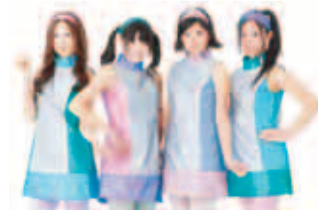
ご当地アイドル「ミラクルマーチ」