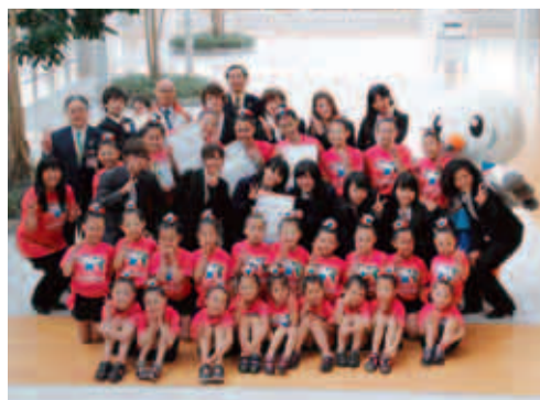
4月1日に市長へ報告のため市役所を訪れた「Space Art Family」と「エンジェルキッズペシャル」の皆さん

郵送で東京都フォークダンス連盟レクリエーション委員会(〒151-0051、渋谷区千駄ヶ谷1-7-9)401、☎03・3796・7811)へ。 ※高校生または18歳未満の参加希望者は、「保護者同意書」の提出が必要です。