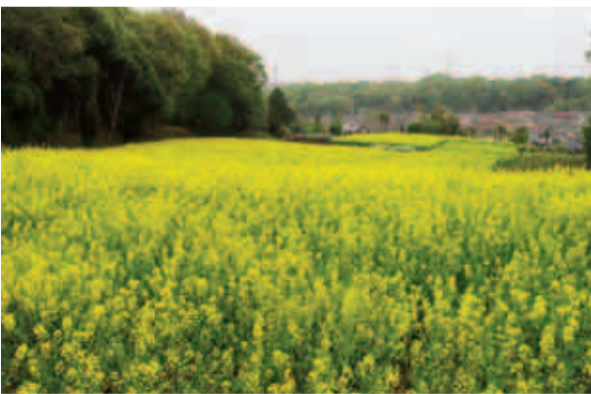
満開の時期には一面が黄色に染まります

薬師池公園の北西、町田ぼたん園やふるさと農具館・七国山ファーマーズセンターの近くにある畑で、黄色がまぶしい菜の花が見ごろを迎えます。