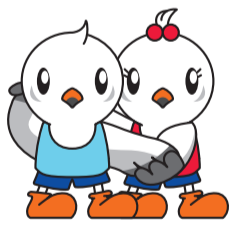
スポーツ祭東京2013のマスコットキャラクター「ゆりーと」

※参加申込書・保護者同意書は国体推進課(市役所本庁舎10階)にあります(スポーツ祭東京2013町田市実行委員会ホームページでダウンロードも可)。 問国体推進課 ☎724・5830 FAX724・5831