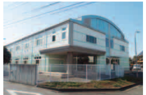
アスク木曾西保育園