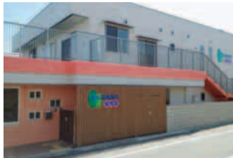
もりのおがわ保育園