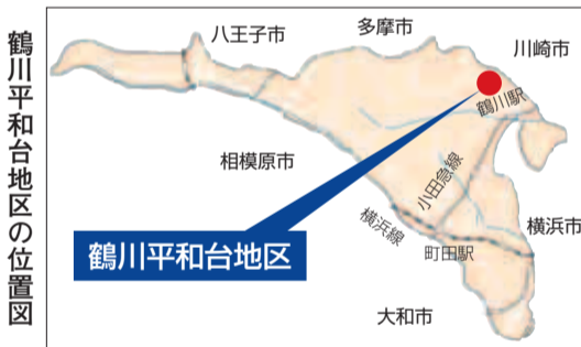
鶴川平和台地区の位置図

市では、地区の特性を生か した住みよい街づくりのため に、住民が主体となって取り 組みを進めています。 このたび、鶴川平和台地区 において、町田市住みよい街 づくり条例(平成15年条例第 49号)に基づく地区街づくり プラン(計画)を、4月下旬 に策定し、告示する予定です。 また、同条例第12条に基づ く街づくり推進地区への指定 を、5月1日に予定していま す。これにより、地区内で建 築等を行う場合は、事前の届 出等が必要となります。対象