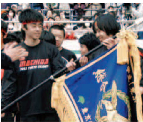
男子・女子チームのキャプテンに優勝旗が 授与されました