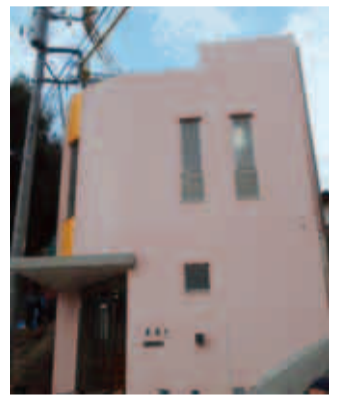
こっこのもり保育園

*1 民間所有者から土地と建物の提供を受けて保育所を開設する新 築型、借り受けた建物を運営法人が改修して保育所を開設する改修 型の2種類があり、20年の間、認可保育所を運営していただく制度 です。市は土地・建物提供者及び運営法人に対し、補助を行います。 *2 幼保連携型認定こども園では、原則3歳児以上は提携する幼稚園 へ入園します。