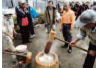
皆さんで楽しめるイベントが盛りだくさんです