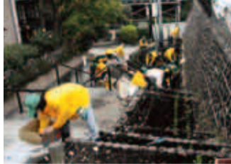
公園等の美化活動は犯罪防止にも役立っています