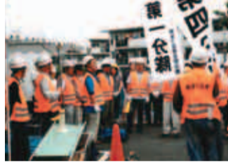
災害時にはご近所同士のコミュニケーションが大切です

どなたでも参加できる季節のお祭りや運動会、旅行等を企画しています。世代を超えた交流も楽しめます。