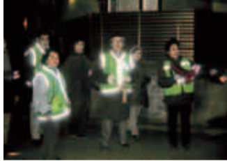
昼夜問わずパトロールを行っています