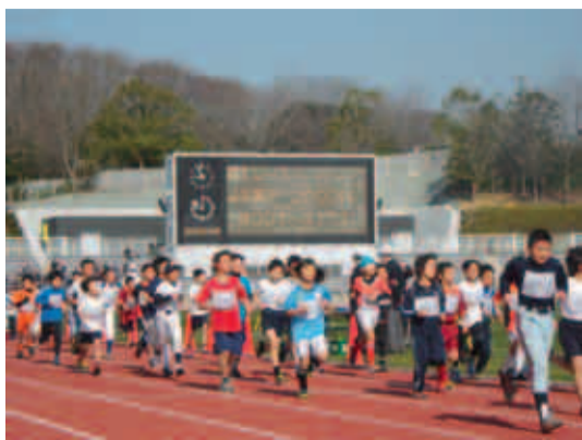
新しくなったコースで素晴らしい走りを見せてくれました

第40回町田市こどもマラソン大会が、3月9日、リニューアルオープンした市立陸上競技場で行われました。春の暖かい陽気の中、市内の小学3〜6年生1790人が元気一杯走りしました。上位入賞者(1位〜3位)は下表のとおりです。