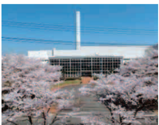
稼働から30年が経過した清掃工場 (町田リサイクル文化センター)

まず、焼却施設、バイオガス化施設などを一併整備する「熱回収施設等」は、「町田リサイクル文化センター」敷地内に整備したいと考えています。また、ビン・カン選別処理、プラスチックの中間処理施設などで構成する「資源ごみ処理施設」は、収集車の台数や移動距離を削減し環境への負担軽減を図られることや、施設の代替性と補完性を備えられること、そして地域住民のごみの資源化に関する意識の向上を促す拠点として、市内3か所に分散化し整備を図ります。