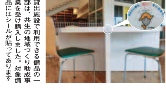
貸出施設で利用できる備品の一部は、共生の地域づくり助成事業を受け購入しました。対象備品にはシールが貼ってあります

※定員は変更する場合があります/会議室と会議室(託児室)は、仕切りを取って1つの部屋としても利用できます(料金は合算)/プレイルームとリハーサル室は会議室としても利用できます。