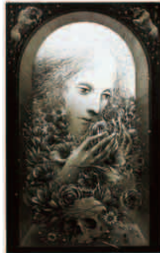
坂東壮一(1937年〜)「四季・春」1980年 エッチング