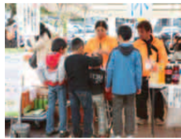
さまざまな活動をお手伝い!

※実施要項、申込用紙は総合体育館とサン町田旭体育館にあります。また、町田市体育協会ホームページ (http://www.machida-taikyo.com) でダウンロードもできます。会員の費用は変わる場合があります。詳細はホームページまたは町田市体育協会へお問い合わせ下さい。