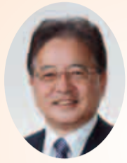
町田市長 石阪 文一

平成25年(2013年)第1回市議会定例会が開会され、石阪市長は2月27日の本会議で施政方針を表明しました。