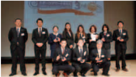
当日参加した表彰受賞者の皆さん

自薦・他薦によりエントリーした58組の個人・団体の中から、桜美林大学ソングリディング部CREAMがグランプリの栄冠に輝きました。また、準グランプリには、夏のロンドンオリンピックに