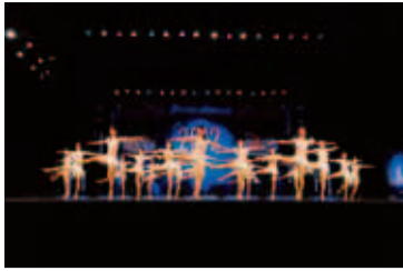
CREAMの世界選手権での演技

自薦・他薦によりエントリーした58組の個人・団体の中から、桜美林大学ソングリディング部CREAMがグランプリの栄冠に輝きました。また、準グランプリには、夏のロンドンオリンピックに