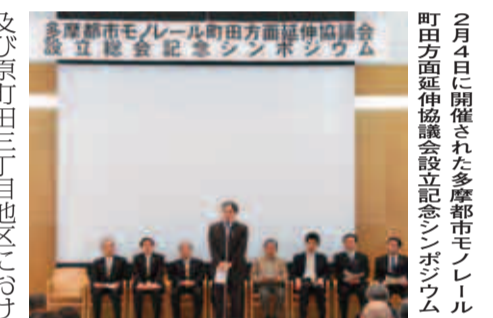
2月4日に開催された多摩都市モノレール町田方面延伸協議会設立記念シンポジウム

また、我が国では人口減少社会に突入しており、2011年度の人口は、対前年比で約21万人減少したとされています。今後、人口減少のペースは更に加速することが見込まれ、町田市においても将来にわたって人口減少に対するさまざまな対応が必要になると考えています。