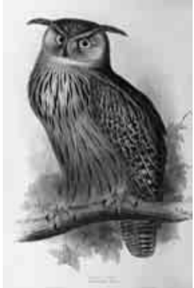
ジョン・グールドの鳥類 図譜から「ワシミズク」