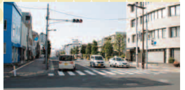
町田街道の「中町一丁目交差点」から進入できるようになりました