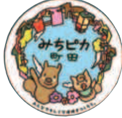
ステッカーは、直径10.6cmと8.1cmの2種類です

みちピカ町田は、市が2010年2月に開始した道路愛護運動です。 個人でも団体でも参加できます。ぜひご参加下さい。 参加者には次のことをお願います。 ○道路をより良くしようという心がけ、行動する ○みやびピカ町田のステッカー