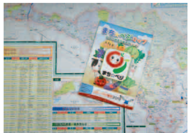
町田産農産物のシンボルマーク「まち☆ベジ」が表紙です

市内で生産した安全で新鮮な地場農産物は、農家の皆さんが軒先などに設置した農産物直売所等で販売しています。