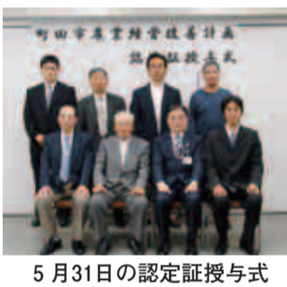
5月31日の認定証授与式

者として認定するものです。今回は9人で、町田市では合計90人になりました。東京都内でも、5番目に認定農業者の多い市町村です。