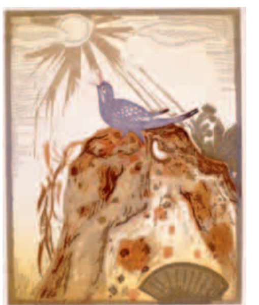
広島新太郎「岩上小禽」1916年ごろ 木版 小野忠重版画館蔵

版画家で版画史研究家でもあった小野忠重(1909～1990)が集めた貴重なコレクションと、国際版画美術館が25年間にわたって収集してきた近代日本版画の中から、個性的で内容豊かな創作版画をセレクトして展示します。約30作家、230点の作品の魅力をご堪能下さい。