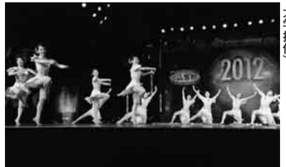
世界選手権での演技

アを募集します。対市内在住、在勤、在学の18歳～25歳で、元気で活発なネットワークの軽い方(10人程度(選考)) 申込用紙(町田市ホームページ、またはスポーツ祭東京2013町田市実行委員会ホームページでダウンロード)に必要事項を記入し、7月31日までに郵送、FAXまたはEメールで国体推進課(〒194-0045、南成瀬5-12、総合体育館内 ☎724・5831 volunteer@tokyo-kokutai2013-machida.jp)へ。 ☎国体推進課 ☎724・5830 ※スポーツ祭東京2013町田市実行委員会では、ホームページやツイッターなどでスポーツ祭東京2013の情報を提供していきます。 ホームページ: http://tokyo-kokutai2013-machida.jp/ フェイスブック: https://www.facebook.com/Machida2013kokutai ツイッターアカウント: @Machida_Kokutai