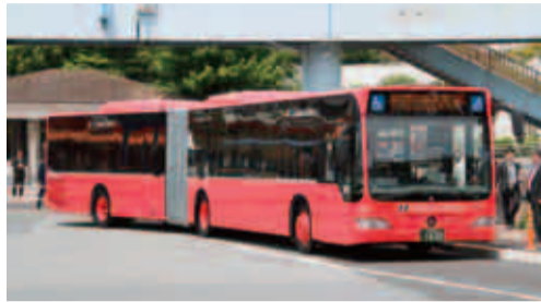
車幅約2.55m、長さ約18m、定員129人で、車両が2台連なった形です