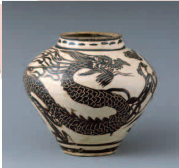
白地鉄絵龍鳳文壺 中国・元時代(14世紀)高さ26.0cm 町田市立博物館蔵