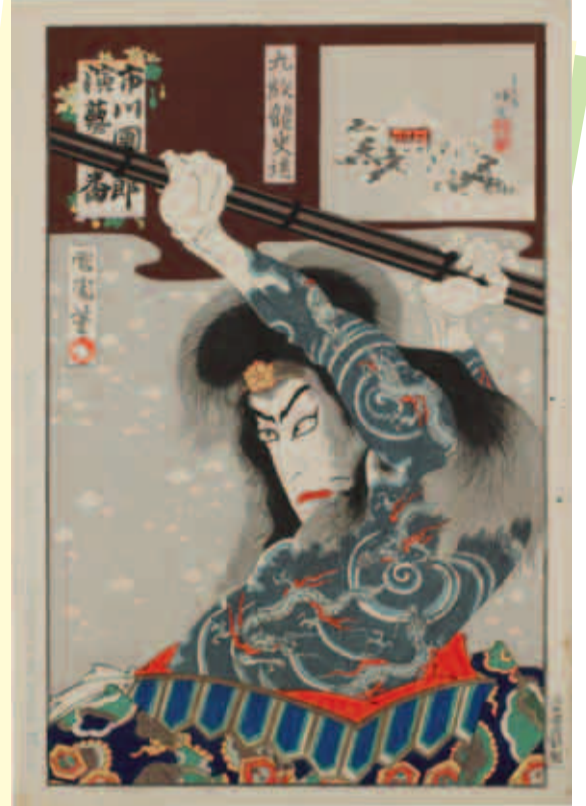
豊原国周(1835[天保6]~1900[明治33])作 『市川團十郎演芸百番』より「九紋龍史進」 1898(明治31)年 331×216mm 町田市立国際版画美術館蔵