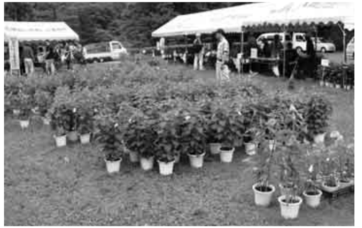
さまざまな鉢物が出品されます（写真は昨年の様子）